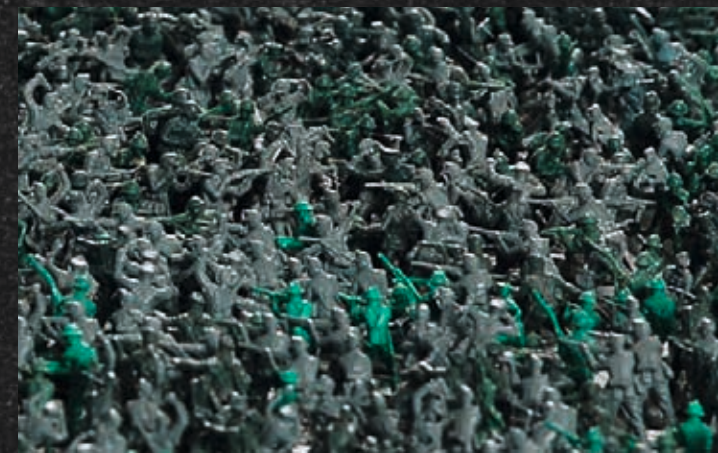
Veronika Dreier, Teppich (Detail), 1994, Veronika Dreier, Graz