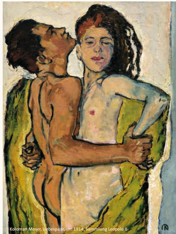
Koloman Moser, Liebespaar, um 1914, Sammlung Leopold II