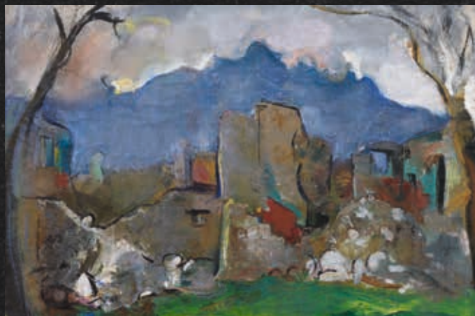
Anton Kolig, Ruinenlandschaft (Detail), um 1917, Privatsammlung, © Bildrecht, Wien 2014

Im Rahmen eines exklusiven Abendprogramms außerhalb der regulären Öffnungszeiten bieten wir Führungen auch gerne mit Catering an. Informationen unter: www.leopoldmuseum.org/de/vermietung