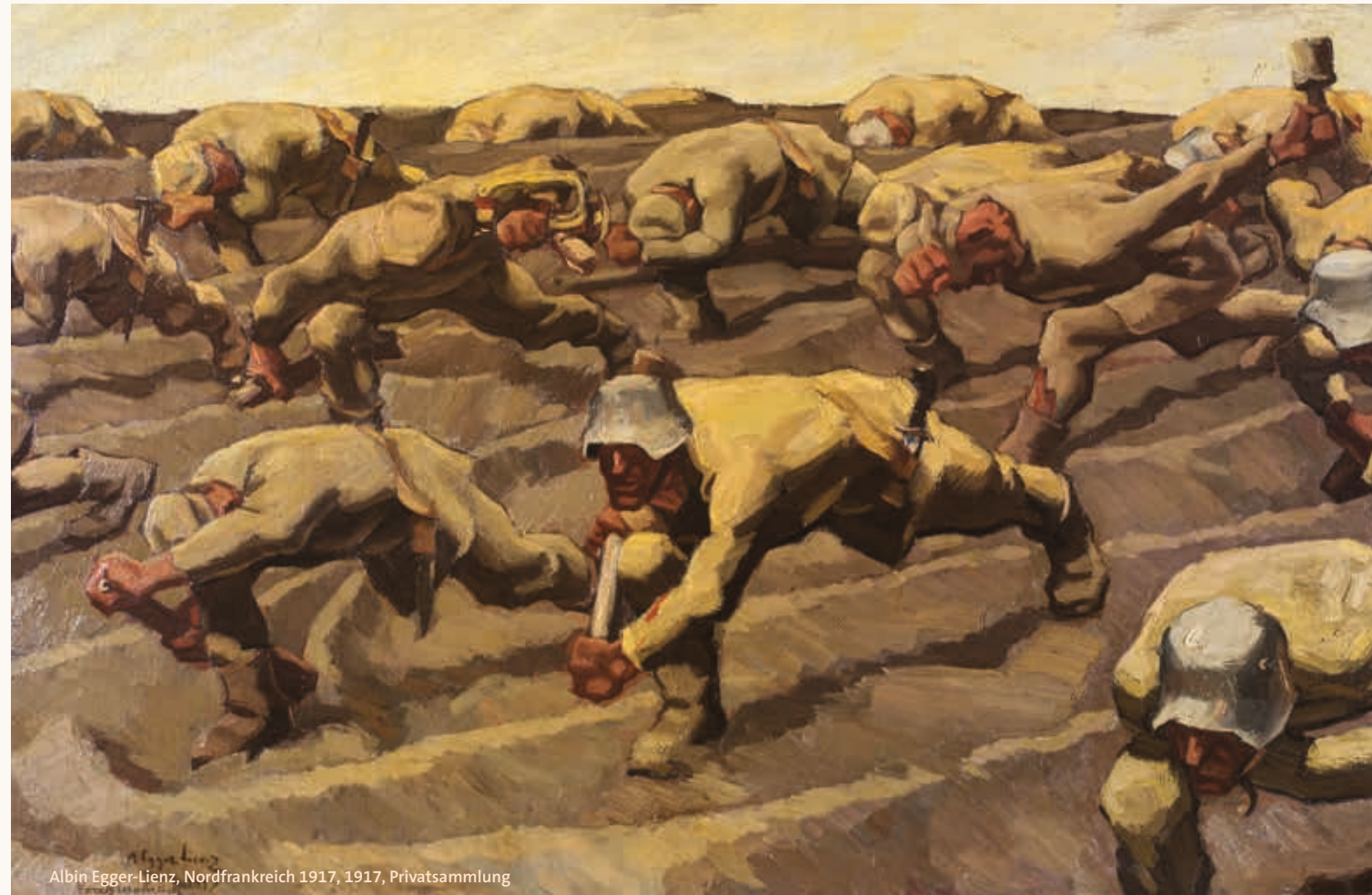
Albin Egger-Lienz, Nordfrankreich 1917, 1917, Privatsammlung

There is an english catalogue available in the Leopold Museum Shop