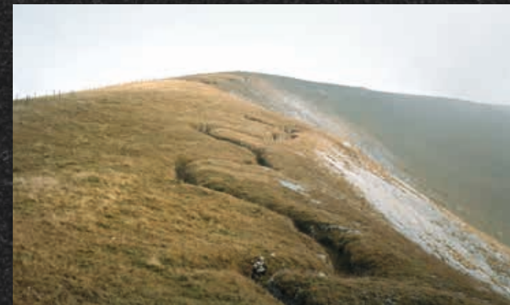
Paola De Pietri, Monte Fior (aus der Serie To Face) (Detail), 2009–2011