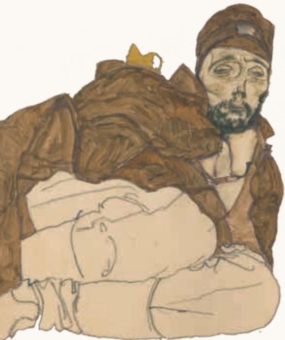
Egon Schiele, »Kranker Russe«, 1915, Leopold Museum, Wien, Inv. 3639

Der Titel der Ausstellung »Trotzdem Kunst!« lässt viele Lesarten zu und umfasst auch den Kunstbetrieb, der während des Krieges nie stillstand: umfangreiche Ausstellungen wurden organisiert, Aufträge vergeben und Bildverkäufe in die Wege geleitet. Die k. u. k. Armee kämpfte damals vor allem an den Fronten gegen Italien, Rumänien, Russland und Serbien, weshalb das Leopold Museum nun, 100 Jahre später, Künstlerinnen und Künstler aus diesen Ländern und aus Österreich eingeladen hat, ihre heutige Sicht auf den Ersten Weltkrieg darzubieten.