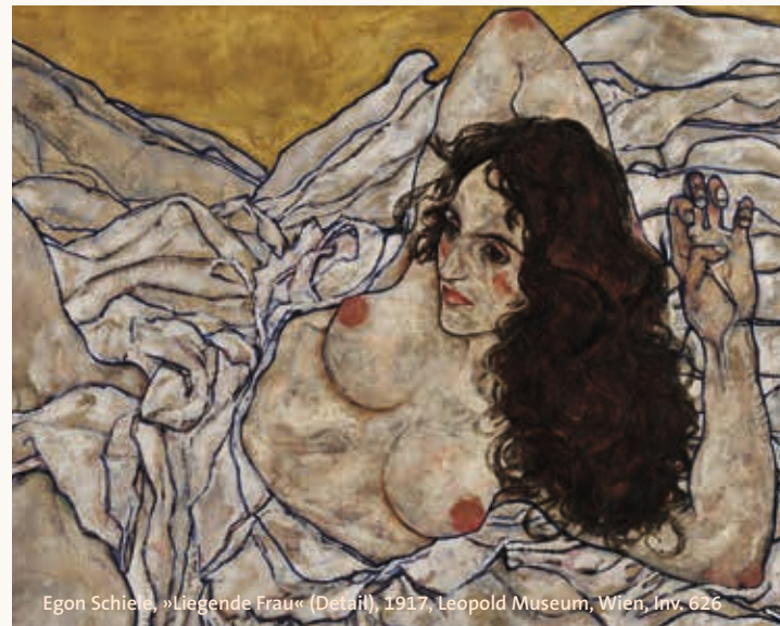
Egon Schiele, »Liegende Frau« (Detail), 1917, Leopold Museum, Wien, Inv. 626