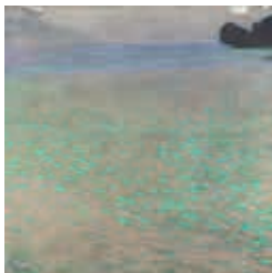
GUSTAV KLIMT 1862–1918 AM ATTERSEE, 1900