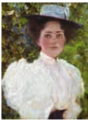
GUSTAV KLIMT 1862–1918 MÄDCHEN IM GRÜNEN, 1896–1899 GIRL IN THE FOLIAGE