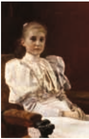
GUSTAV KLIMT 1862–1918 SITZENDES JUNGES MÄDCHEN, UM 1894 SEATED YOUNG GIRL, C. 1894